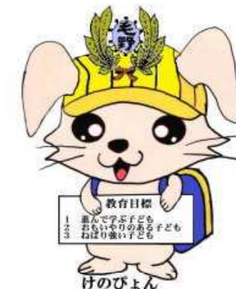
毛野小のマスコット