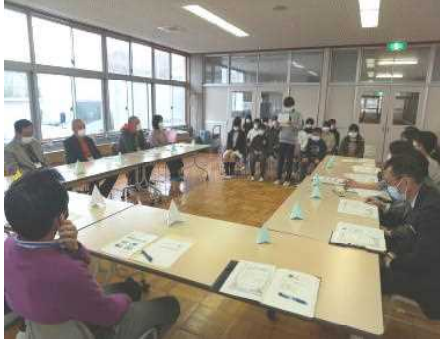
【保健委員長の発表】

児童会、保健委員会の展示活動が11月30日から12月7日まで「身体のいろいろな部分で健康を考えてみよう」のテーマで行われました。最終日には学校保健委員会及び学校評議員会を校医さんや薬剤師さん保護者の皆さんと共に実施しました。その中で保健委員長が展示活動の発表をしました。校医さん達から展示についてのお褒めの言葉をいただいたり、コロナ過での歯磨きの方法なども指導いただいたり有意義な時間でした。