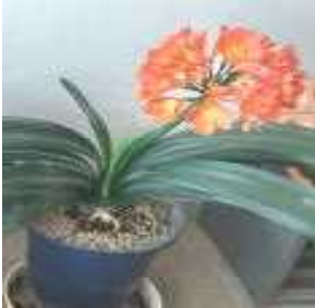
【来賓玄関の君子蘭】