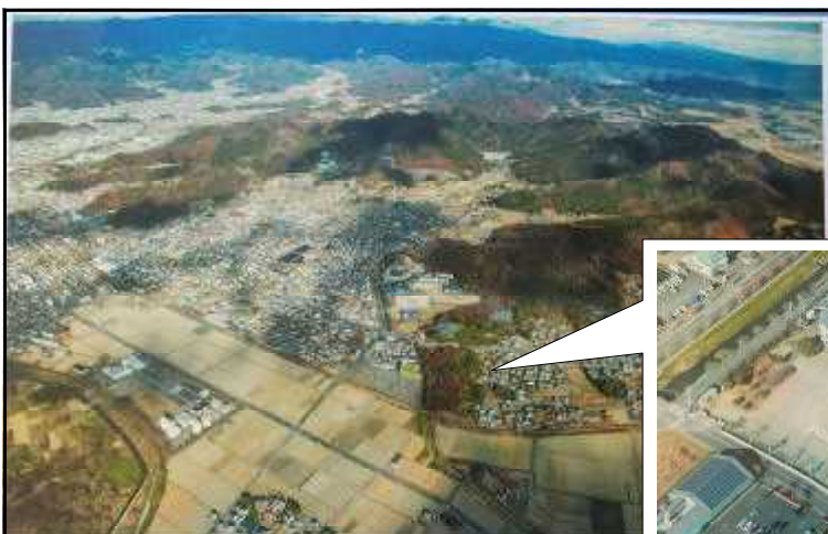
足利市立毛野小学校 令和2年度撮影

みんなで校庭に大きな「けのびょん」を作りました。学級写真と共に宇宙へ向かいます。