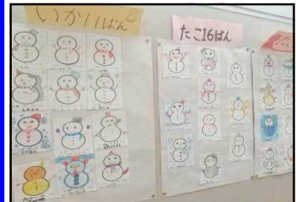
【各縦割り班でのゆきだるまカード】

「ゆきだるまみれ大作戦」毛野っこ集会ができないために、縦割班の友達とのつながりを雪だるまを通して高めます。それぞれのかわいい雪だるまが3階に掲載してあります。