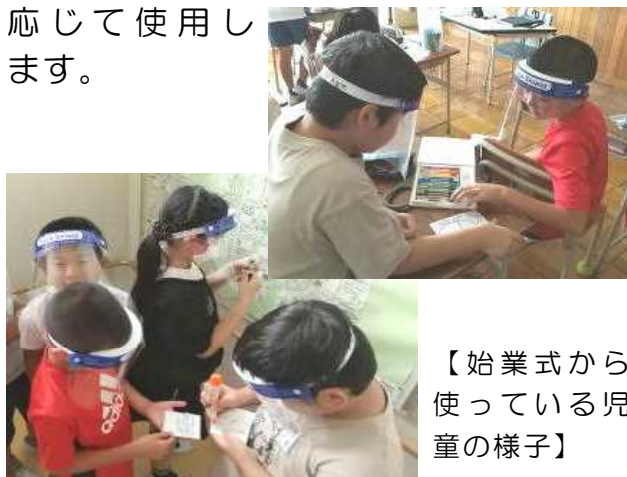
【始業式から使っている児童の様子】

特にグループ活動等、児童同士の話し合い活動や児童が密接になる活動に応じて使用します。